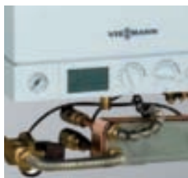
Kit Solar para Vitodens 100-W

La caldera de condensación a gas Vitodens 100-W le ofrece una relación calidad-precio especialmente ventajosa sin renunciar a la calidad